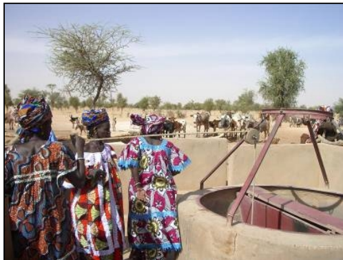
Bruk av Vanntankens brønn i Sourindé.

Vanntanken ønsker alle i Hemne en god jul og et godt nytt år og hilser spesielt til de som bidrar til Vanntanken.